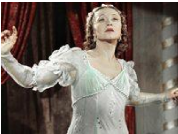
Легенда советского балета XX века

5 заданий с выбором одного правильного ответа